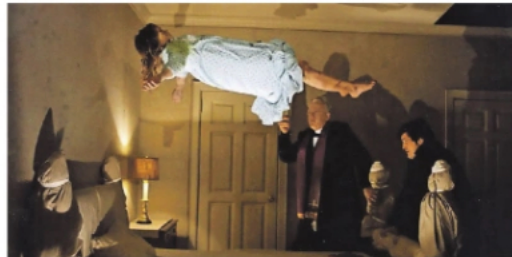
Beelden uit Jaws , Teletubbies , Psycho en The Exorcist .